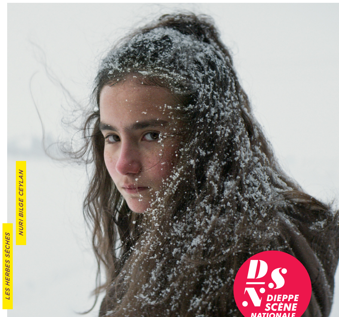
LES HERBES SÈCHES NURI BILGE CEYLAN