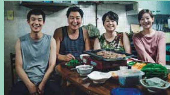
Parasite de Bong Joon Ho, Palme d'or 2019, présenté en exclusivité à DSN a rassemblé plus de 700 spectateurs la saison dernière.

900 séances pour plus de 250 films par an à partir de 5€ pour les adhérents détenteurs de la formule cinéma (4€ pour les moins de 25 ans).